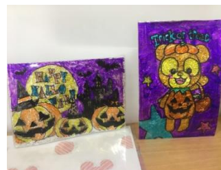
プラバンでステンドグラス風アート