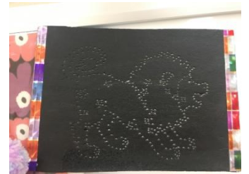
発砲スチロールで星座作り