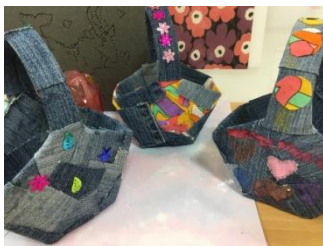
ジーンズと牛乳パックでかばん作り